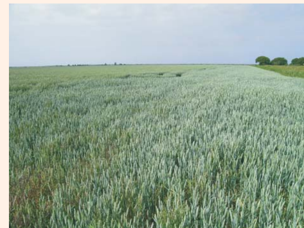
Weizenanbau im Speicherkoog in Dithmarschen

Kalkmarschen gehören weltweit zu den produktivsten Ackerstandorten. Hohe Nährstoffreserven der im Sediment enthaltenen organischen Substanz und die gering verwitterten Minerale sowie hohes Speichervermögen für Wasser, verbunden mit einem vom Menschen regulierten Grundwasserhaushalt, ermöglichen Erträge von über 10 t Weizen oder 4 t Raps pro Hektar. Das gilt für trockene und nasse Jahre gleichermaßen.