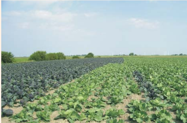
Rot- und Weißkohlanbau im Speicherkoog

Wie alle Böden erfüllen Kalkmarschen auch Archivfunktionen. So lassen sich aus ihren typischen Merkmalen auch Rückschlüsse auf frühere Nutzung unter anderen Klimabedingungen gewinnen.