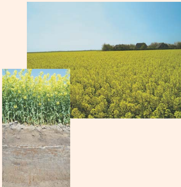
Kalkmarsch mit Rapsanbau im Finkhaushalligkoog in Nordfriesland

Kalkmarschen sind kalkhaltige, tidebeeinflusste Grundwasserböden aus marinen Ablagerungen. Unter einem in der Regel gepflügten, humosen Oberboden mit lockerem Krümelgefüge folgt ein mehr oder weniger stark rostfleckiger Horizont im Schwankungsbereich des Grundwassers. Der darunter folgende, ständig mit Wasser gesättigte Bereich ist durch Eisensulfide dunkelgrau bis schwarz gefärbt. Der Unterboden ist in der Regel deutlich geschichtet.