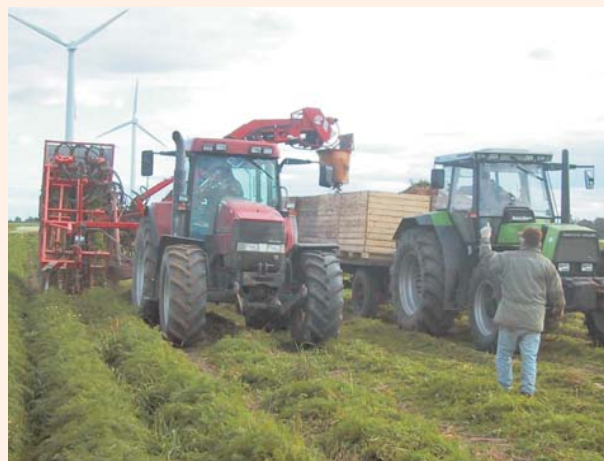
Einsatz von schweren Landmaschinen in Dithmarschen

Kalkmarschen bedürfen einer sorgfältigen Regulierung des Grundwassers durch Entwässerung und Ableitung des Überschusswassers über Siele in die Vorflut oder in das Meer.