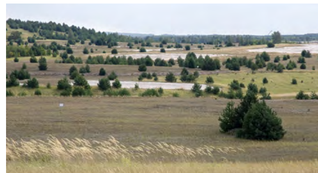
Kippen-Landschaft im NABU-Naturparadies Grünhaus

Kippenflächen mit kleinflächigem Substratwechsel werden nicht oder nur geringfügig melioriert. Solche Areale mit großer Heterogenität ökologischer Bedingungen auf engem Raum bleiben meist sich selbst überlassen. Sie bieten für Pflanzen und Tiere ein Mosaik unterschiedlichster ökologischer Nischen, die in unserer stark genutzten „Kulturlandschaft“ kaum mehr zu finden sind. Sie können für den Arten- und Biotopschutz wertvoll sein.