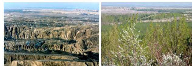
Kippe des Tagebaus ‚Klettwitz‘, Lausitz, vor Beginn der Sanierung 1995 und 2018

Die Wiederherstellung von funktionierenden Ökosystemen auf den vom Bergbau hinterlassenen Flächen ist eine wahre „Herkulesaufgabe“. Mit langem Atem, dem nötigen Sachverstand und dem Engagement aller Beteiligten können aus zerstörten Fluren wieder neue, vielfältig nutzbare Landschaften und multifunktionale Böden entstehen.